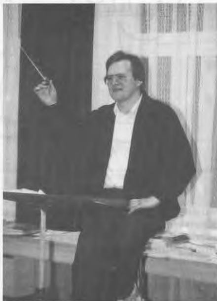
Der Kapellmeister bei der Probe.

1. Mai - Marschmusik Florianifeier der Feuerwehren Erstkommunion Pferdemarkt 100 Jahre FF Schlatt; mit einem 3-Tage-Einsatz in Schlatt