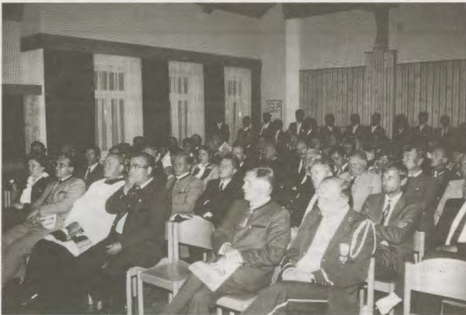
Die Festgäste bei der Eröffnungsfeier im neuen Probesaal des Musikerheimes.

Im Jahr 1988 hatte die Stadtkapelle zweifachen Grund zur Freude: Wir konnten das 120jährige Bestandsjubiläum des Musikvereines und die festliche Segnung und Übergabe des neuerrichteten Musikerheimes im Rahmen eines eigenen Festwochenendes vom 2. bis 4. September 1988 feiern.