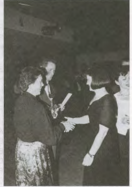
Die glücklichen Gewinner