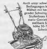
Wiesenmäher UM 2460

Die kompakte Motorhacke mit schwenkbarem Holm für bequemes Arbeiten. Mit zuverlässigem 2,2 kW Motor und 62 cm Arbeitsbreite.