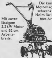
Motorhacke F 210

22 leistungsstarke Modelle. Mit der typischen Leichtstart-Technik. Von 1,8 kW bis 4,0 kW. Von 42 cm bis 53 cm Schnittbreite.